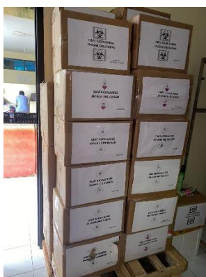
Gambar 3. Persediaan Kadaluwarsa

Berkaitan dengan akurasi, auditor menelusuri penambahan stock bahan baku dengan buku kas dan bank atau akun hutang usaha serta, pengurangan stock barang jadi dengan penjualan. Karena, apabila menggunakan nominal harga yang tidak tepat untuk mencatat penambahan stock dari transaksi pembelian dan kesalahan perhitungan kuantitas dikalikan dengan harga dapat dikategorikan sebagai pelanggaran asersi akurasi.