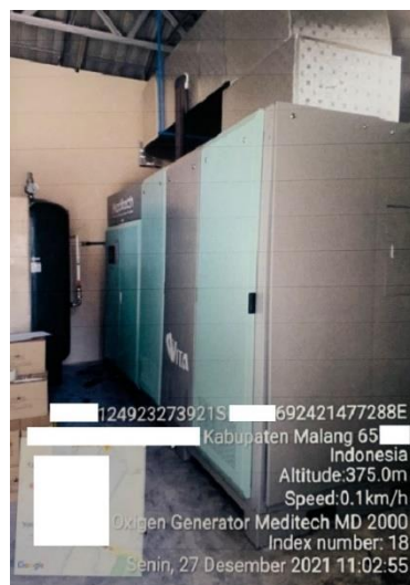
Gambar 4. Foto Aset

“kalau ada penambahan aset tetap 2021, minta kirimin bukti pembelian, terus cek ada barang rusak nggak? Kalau ada yang rusak tanya ke klien apa sudah dibiayakan? Cek juga PPN pembeliannya” (Ardi. 8 Februari 2022).