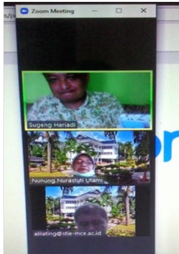
Gambar 2: Rapat via zoom meeteng tentang Perencanaan Diversifikasi Produk Kajoetangan Herrytage