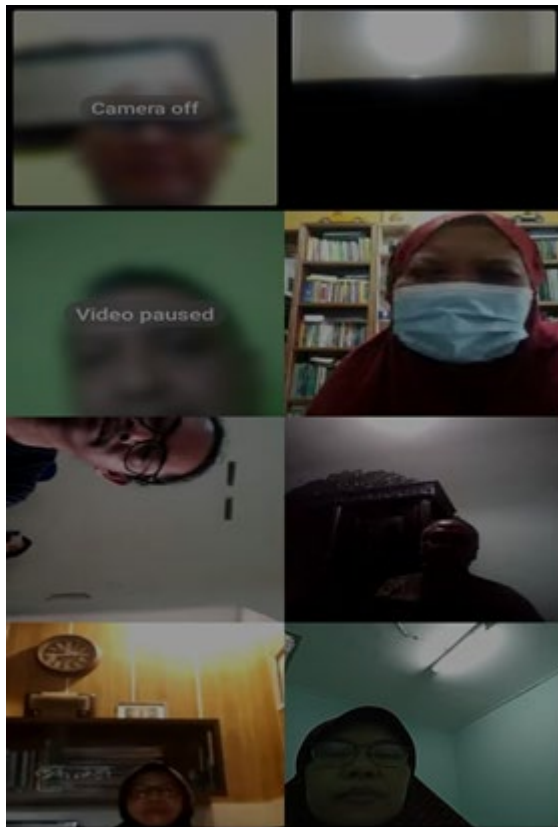
Gambar 3: Sosialisasi Kepada Manajemen Kajoetangan Herrytage Tentang Produk Kue Khas KJT via Vidio Call Group