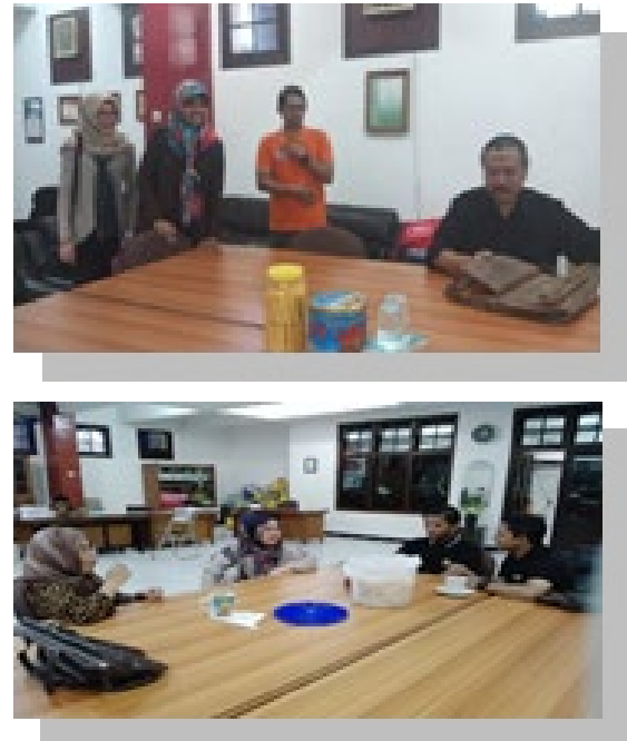
Gambar 1 : kegiatan FGD dengan mitra manajemen Kajoetangan Herrytage.

Hasil kegiatan PKM ini dapat dilihat dari beberapa kegiatan dibawah ini: