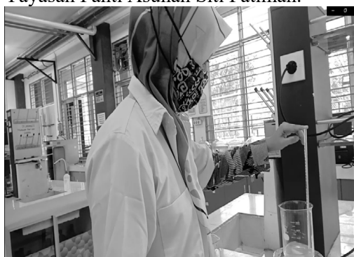
Gambar 1. Pembuatan Sabun Mandi Padat

Sebagai tahap persiapan pembuatan produk, tim PkM melakukan pembuatan sabun mandi padat untuk mendapatkan contoh produk yang akan diberikan kepada Yayasan Panti Asuhan Siti Fatimah.