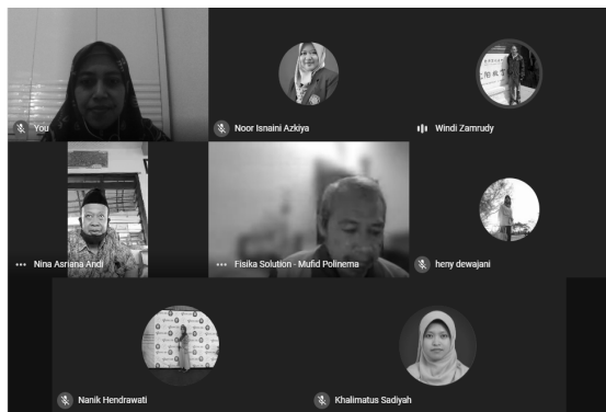
Gambar 6. Pelaksanaan Kegiatan Pengabdian kepada Masyarakat secara Daring