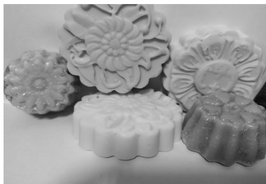
Gambar 3. Contoh produk sabun mandi padat