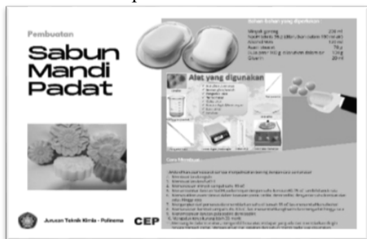
Gambar 2. Modul Pembuatan Sabun Mandi Padat