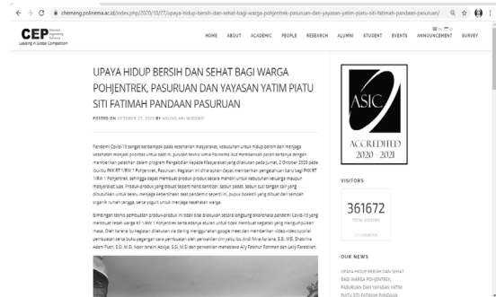
Gambar 8. Publikasi Kegiatan Pengabdian kepada Masyarakat