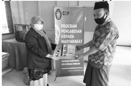
Gambar 4. Penyerahan Modul, Video dan Contoh Produk