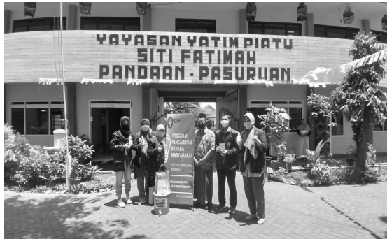
Gambar 5. Perwakilan Tim PkM dibantu mahasiswa bersama dengan Pimpinan Yayasan Siti Fatimah saat kegiatan PkM