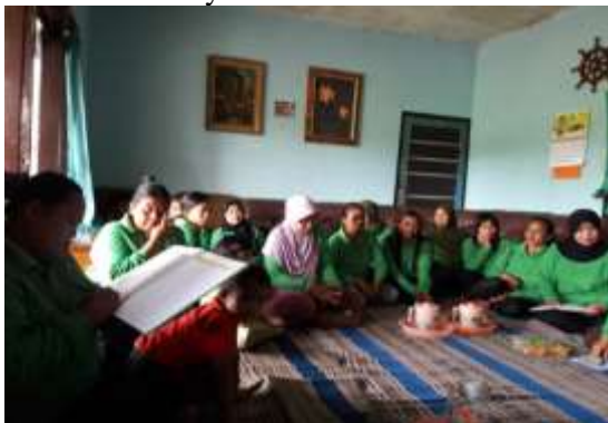
Gambar 2. Proses Pelatihan Administrasi Penjualan Digital pada KWT Dewi Sartika

Menurut Aisyah dkk (2023) dengan menggunakan “Teman Bisnis”, para pengusaha bisa menginput laporan keuangan dimana saja dan kapan saja. Selain itu, Teman Bisnis selalu menjaga ukuran aplikasi agar selalu efisien dan ringan digunakan di mayoritas smartphone yang kita gunakan. Dengan kata lain aplikasi Teman Bisnis ini tidak memakan banyak memori di smartphone yang kita gunakan. Selain kecepatan dalam mengakses yang fleksibel dan gesit, kelebihan lainnya adalah informatif.