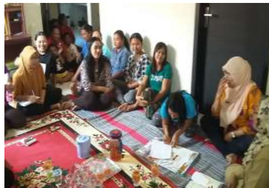
Gambar 1. Diskusi dengan pengurus dan kelompok KWT Dewi Sartika

kebingungan dari Kelompok karena tidak dibedakan antara uang hasil penjualan dan uang kelompok, modal usaha, pendapatan, dan laba rugi. Dokumen administrasi yang digunakan masih sangat sederhana yakni buku catatan manual dan nota yang ditulis manual.