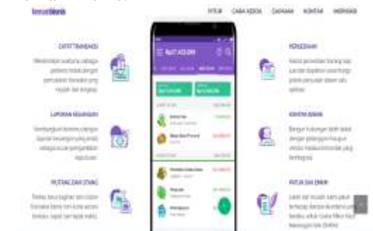
Gambar 3. Tampilan Aplikasi Teman Bisnis

Teman Bisnis ini diawali dengan proses mengajari proses mengunduh aplikasi Teman Bisnis pada Google Playstore , memahami fitur-fitur dan menu yang ada pada tampilan Teman Bisnis, proses data dan transaksi penjualan, melakukan pengolahan laporan keuangan pada aplikasi Teman Bisnis hingga mengunduh hasil laporan keuangan untuk dilakukan analisis dalam pengambilan keputusan bisnis. Dalam kegiatan pelatihan tersebut peserta yakni pengurus KWT Dewi Sartika diminta untuk mempraktikkan satu persatu cara untuk menggunakan aplikasi Teman Bisnis.