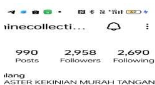
Gambar 9. Jumlah Followers UMKM

Gambar 8 dan 9 membuktikan bahwa UMKM Jasmine Collection telah mampu mengelola akun instagram dengan baik sesuai arahan tim PKM.