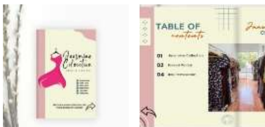
Gambar 4. Hasil desain ebooklet