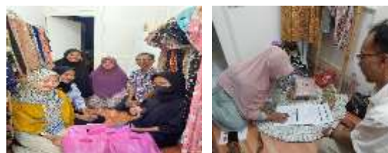
Gambar 7. Bersama pemilik UMKM