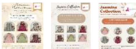
Gambar 3. Hasil desain brosur