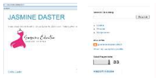
Gambar 5. Hasil desain blogspot