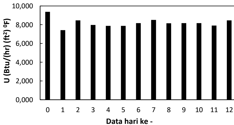
Gambar 3. Grafik koefisien perpindahan panas overall alat jacketed vessel (E-240)

Efisiensi perpindahan panas dapat ditinjau dari nilai koefisien perpindahan panas overall (U). Koefisien perpindahan panas overall merupakan parameter yang menggambarkan efisiensi perpindahan panas dari suatu sistem [19]. Koefisien perpindahan panas overall menunjukkan seberapa besar panas yang dipindahkan melalui suatu alat penukar panas yang mencakup semua mekanisme perpindahan panas seperti konduksi dan konveksi [20]. Semakin tinggi nilai koefisien perpindahan panas overall (U), maka semakin tinggi efisien perpindahan panasnya [21]. Beberapa faktor yang harus diperhatikan agar nilai U semakin optimal antara