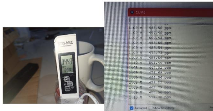
Gambar 7. Pengujian Sensor TDS Pada Air Kolam Bersih

Pada Gambar 6 dan 7 merupakan hasil dari pengujian sampel air kolam kotor dan bersih dengan kondisi semelum melewati proses filtrasi alami dan sesudah melalui proses filtrasi alami. Pembacaan nilai menggunakan alat validasi TDS meter menunjukkan sebesar 1619 ppm untuk air kotor (sebelum melewati proses filtrasi alami) dan air bersih (setelah melewati proses filtrasi alami) sebesar 443 ppm.