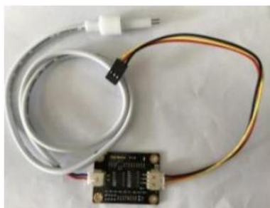
Gambar 2. Sensor TDS (Total Dissolved Solids)

Sensor TDS membuat jumlah zat padat yang terlarut dalam air dalam satuan bagian per juta (PPM). Jumlah ion dalam larutan disebut sebagai PPM. Salah satu parameter yang paling sering dipakai untuk menilai tingkat pencemaran air adalah Total Dissolved Solid (TDS). Maksimal TDS dalam air bersih adalah 1500 mg/l) [9]. Prinsip kerja sensor TDS adalah mengukur konduktivitas listrik dari suatu larutan. Semakin banyak zat terlarut dalam air, maka semakin bagus konduktivitas listriknya. Dengan mengukur nilai konduktivitas, kita dapat memperkirakan nilai TDS dalam larutan tersebut.