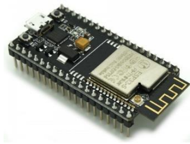
Gambar 3. Modul ESP32