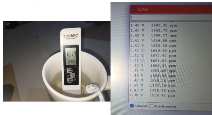
Gambar 6. Pengujian Sensor Pada Air Kolam Kotor