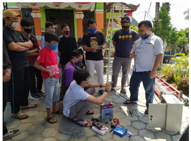
Gambar 4.5 Brifing dan penjelasan