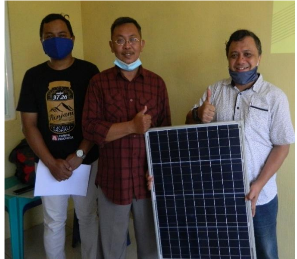
Gambar 4.3 Penyerahan Sel Surya kepada RW 12 Landungsari

Saat di ruangan V_{out} = 10.7 Volt Saat di luar ruangan dan terkena sinar matahari V_{out} = 17,4 Volt