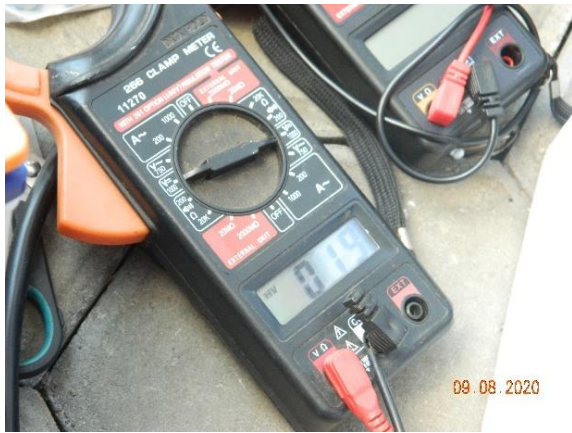
Gambar 4.2 Peralatan ukur

Setelah identifikasi peralatan dirasa cukup, dengan dibantu beberapa mahasiswa, peralatan dibawa ke titik kumpul dengan tim RW 12 untuk selanjutnya dilakukan brifing sebelum pemasangan.