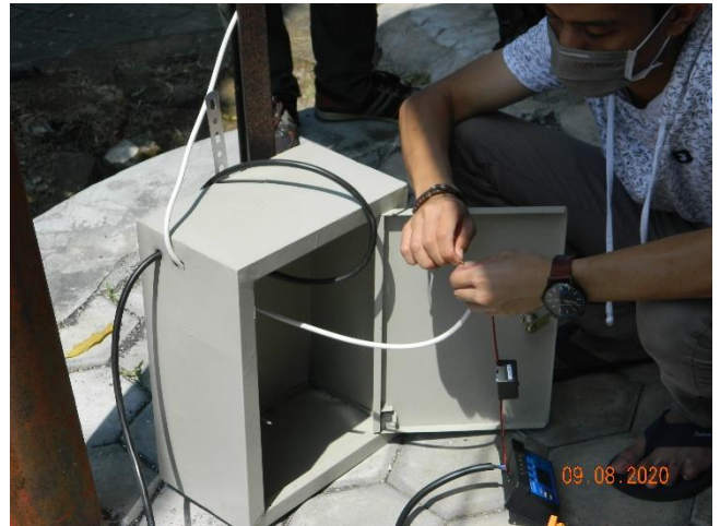
Gambar 4.4 Pemasangan Box panel untuk Charge Controller dan baterai