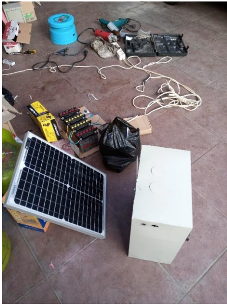
Gambar 4.1 Persiapan peralatan sel surya dan peralatan pendukung

Setelah identifikasi peralatan dirasa cukup, dengan dibantu beberapa mahasiswa, peralatan dibawa ke titik kumpul dengan tim RW 12 untuk selanjutnya dilakukan brifing sebelum pemasangan.