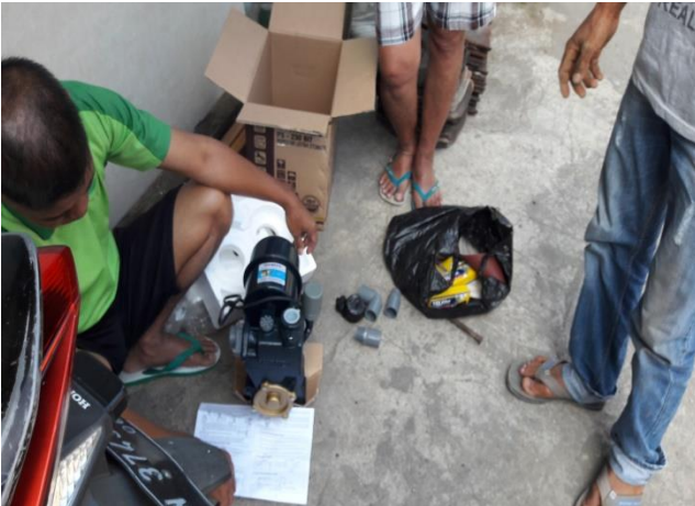
Gambar 4.3 Bahan / Material yang akan dipasang

Setelah identifikasi peralatan dirasa cukup, dengan dibantu beberapa mahasiswa, peralatan dibawa ke titik kumpul dengan tim RW 8 untuk selanjutnya dilakukan pengarahannya sebelum pemasangan.