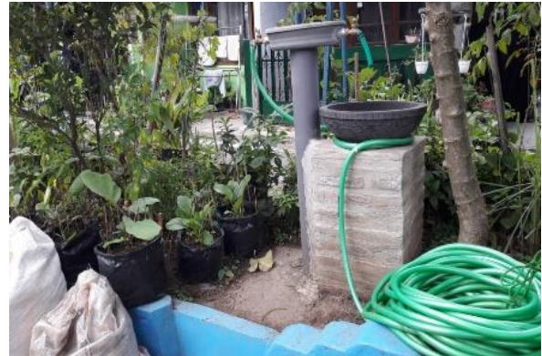
Gambar 4.5 Hasil akhir pemasangan instalasi air bersih untuk keperluan cuci tangan.

pribadi dan orang lain dengan makin sering mencuci tangan untuk mencegah penyebaran pandemi Covid-19 yang makin meluas khususnya di wilayah RW 8 kelurahan Kesatrian.