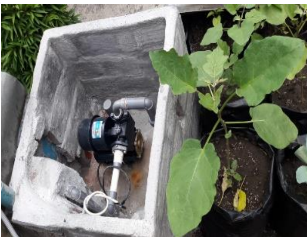
Gambar 4.4 Instalasi mesin pompa air dan bak penampungan / tangki

Peralatan pompa yang dipakai adalah produk Shimizu PC 260 BIT sebagai jet pump dengan kemampuan tarikan head untuk kedalaman 15 meter atau maksimal 30 meter. Level tegangan pompa pada 240 V AC dengan rating daya 125 W. Setelah dipasang pada tempatnya, warga memastikan beberapa hal yang harus diperhatikan antara lain : memastikan kelancaran pasokan air tanah di lingkungan RW 8 kelurahan kesatrian baik itu di musim hujan maupun kemarau. Memastikan kualitas air tanah di lingkungan bersih dan tidak berbau. Kemudian warga menyediakan tempat untuk meletakkan bak penampung air / tangki. Agar listrik tetap hemat tangki disediakan sehingga mesin lebih awet dan untuk mengantisipasi mati listrik agar tetap dapat beroperasi dengan lancar maka perlu dilakukan pemasangan tangki / bak penampungan.