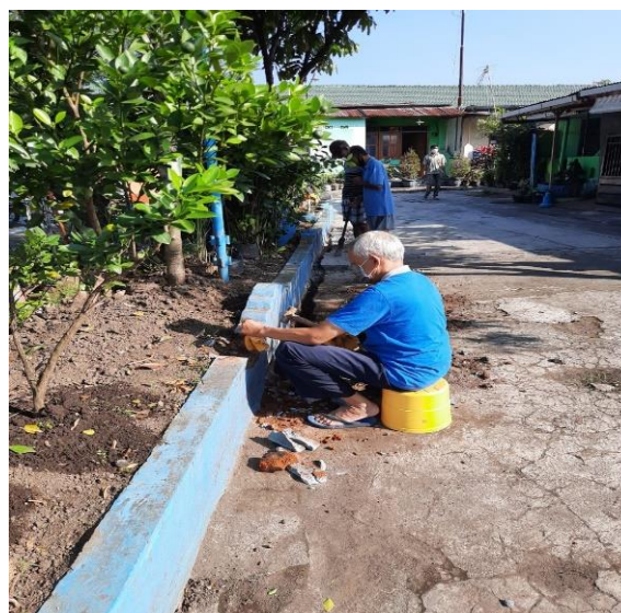
Gambar 4.1 Persiapan jalur instalasi saluran air

Kegiatan ini terlaksana dengan Kerjasama Pimpinan dan staff serta seluruh warga RW 8 kelurahan kesatrian, bersama-sama tim PKM Polinema terdiri dari dosen dan relawan mahasiswa. Dimulai dengan persiapan peralatan, dan pengumuman pada Grup Whatsapp warga, mengingat pada masa ini adalah pandemic covid-19. Kendala yang dihadapi adalah tim PKM mempersiapkan beberapa hal terkait protocol Kesehatan di tempat berkumpulnya warga, diantaranya penyediaan masker, tempat cuci tangan dan pengaturan tempat.