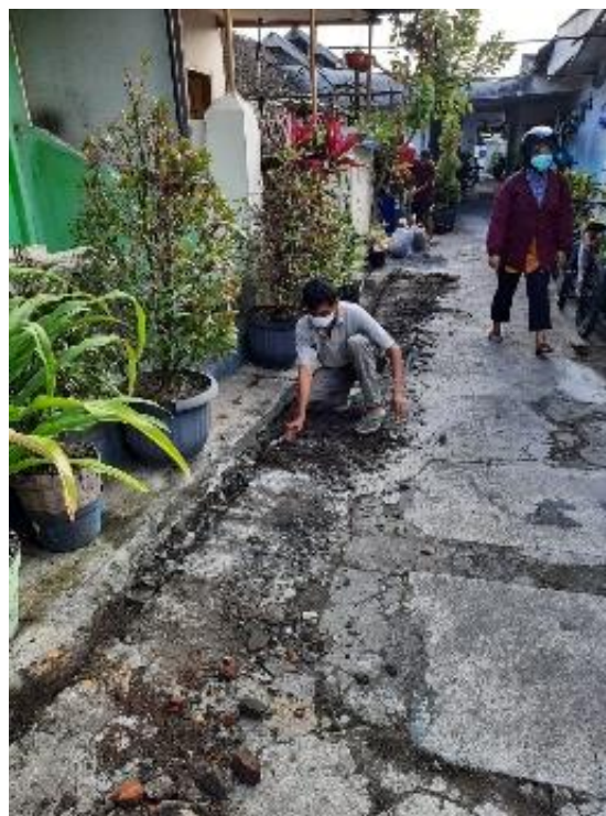
Gambar 4.2 Pembersihan area kerja