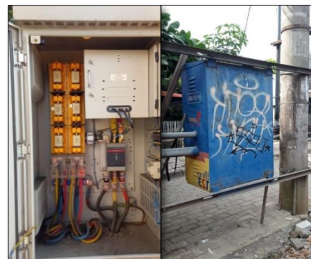
Gambar 2.1 Panel Transformator Distribusi