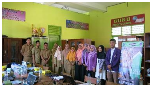
Gambar 4. Pelatihan Pustakawan