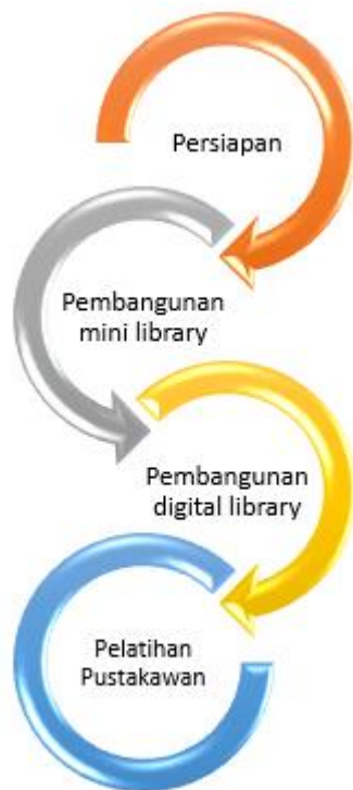
Gambar 2. Tahapan Pelaksanaan

Upaya untuk meningkatkan budaya membaca dan menarik minat mengunjungi perpustakaan adalah melengkapi fasilitas dengan furniture, komputer, sekaligus sistem informasi untuk memudahkan pencatatan dan melakukan pengarsipan data. Untuk mengatasi permasalahan yang dijelaskan pada bab sebelumnya, maka diusulkan untuk dibangun mini library dan digital library. Program Peningkatan Budaya Baca Guru dan Siswa Melalui “Mini Library dan Digital Library” di Yayasan Pendidikan Ar-Rahman Kota Kediri dilaksanakan dalam tahapan seperti yang digambarkan pada diagram berikut: