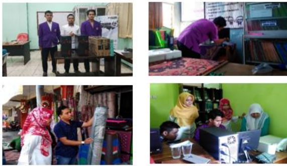
Gambar 3. Dokumentasi Rangkaian Kegiatan Pengabdian Masyarakat