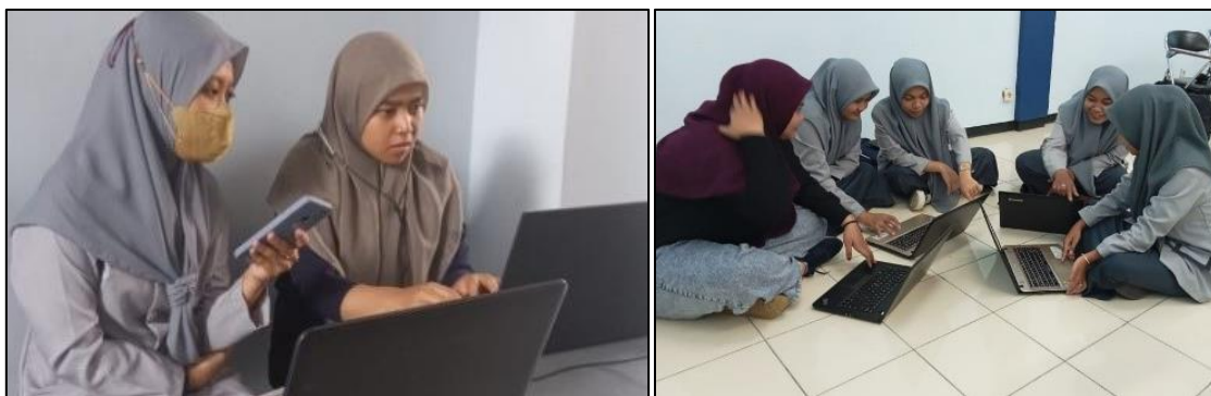
Gambar 4. Kegiatan Pendampingan

Pelaksanaan kegiatan pendampingan dilakukan setelah kegiatan pelatihan. Pendampingan kepada mitra dilaksanakan selama 2 bulan yaitu Bulan Mei 2023 sampai dengan Bulan Juni 2023 seperti pada Gambar 4.