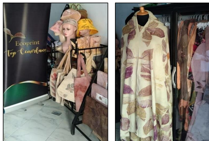
Gambar 2. Produk UMKM Batik Top Cemerlang