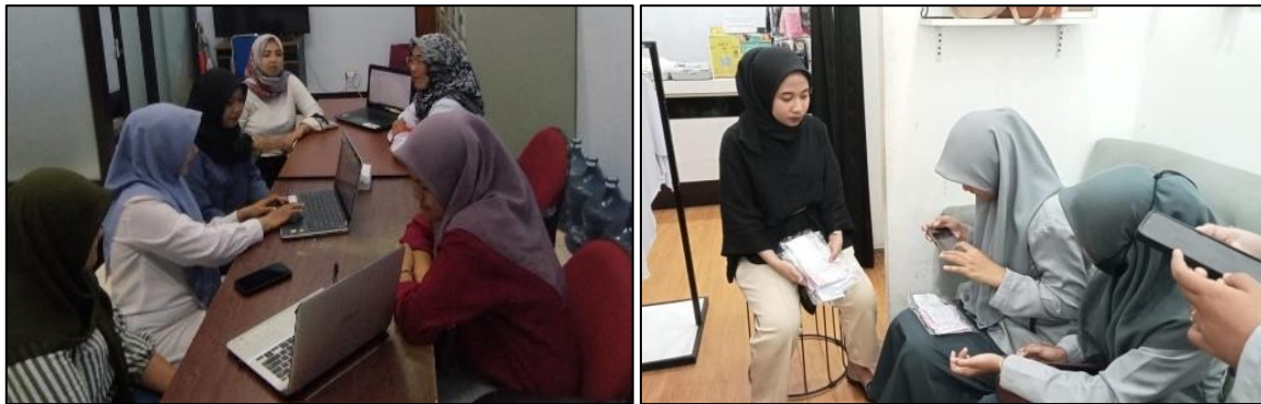
Gambar 3. Kegiatan Pelatihan

Versi 25. Pemanfaatan media online sebagai sarana pemasaran diharapkan Mitra dapat menambah pendapatan dari penjualan produk. Dalam pelatihan dan pendampingan pemasaran menggunakan media online ini, Mitra dapat menggunakan media Instagram dan Whatsapp untuk promosi dan memperkenalkan berbagai produk Mitra seperti yang ditunjukkan Gambar 3.