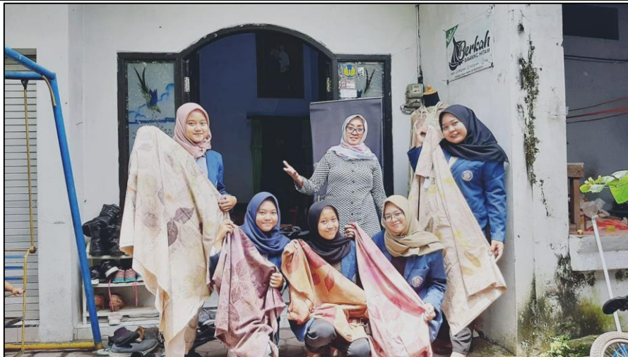
Gambar 5. Foto Kegiatan di Mitra

Implementasi pendampingan pencatatan laporan keuangan menggunakan aplikasi ABSS Versi 25 menghasilkan laporan keuangan UMKM Batik Top Cemerlang Bulan Mei 2023 seperti pada Gambar 6.