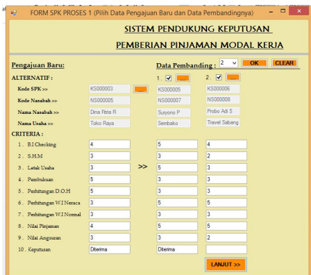
Gambar 3 Tampilan Proses 1 SPK

Tampilan ini adalah proses pertama dalam proses perhitungan metode TOPSIS yaitu memasukan data pengajuan baru dan akan dibandingkan oleh siapa.