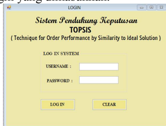
Gambar 1. Form login

user ID dan password sampai database membaca benar data login yang dimasukkan.