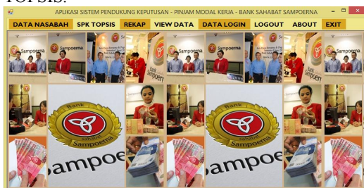
Gambar 2 Tampilan Menu Utama

Pada tampilan form menu utama ini dapat dilihat terdapat menu-menu yang dapat dipilih untuk berinteraksi dalam proses pendukung pemilihan pemberian kredit pada nasabah dengan metode TOPSIS.