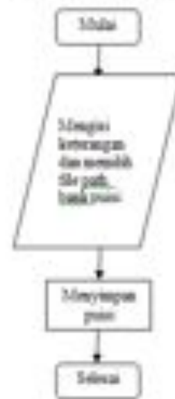
Gambar 3.1 Flowchart Diagram Simpan Bank Puisi

Preproses adalah alur kerja sebelum mesin pembuat puisi ini menghasilkan puisi baru. Disini ada dua tahap sekaligus yang dikerjakan, yaitu upload bank puisi dan memecah kata. Flowchart simpan bank puisi dijelaskan sebagai berikut: