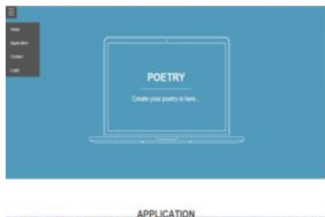
Gambar 3.3 Tampilan dropdown menu

Web ini merupakan satu slide, dimana masing-masing menu dapat dilihat di menu dropdown sebagai berikut: