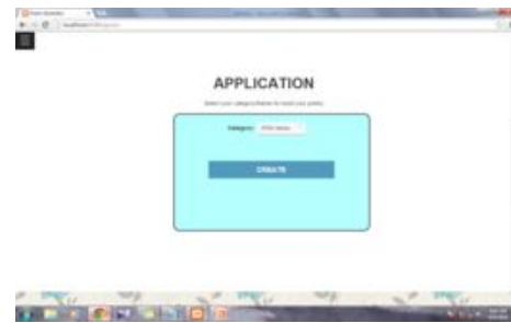
Gambar 3.4 Tampilan menu Application

Untuk menuju menu 'Application', maka klik menu 'Application' dan kursor akan mengarahkan ke tampilan dibawah ini: