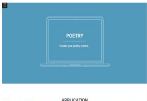
Gambar 3.2 Tampilan awal web

Dibawah ini adalah tampilan awal web mesin pembuat puisi.