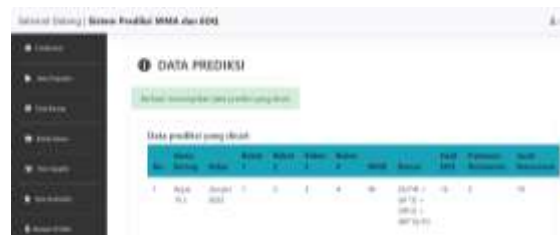
Gambar 4. Tampilan hasil prediksi

Gambar 4 merupakan tampilan halaman hasil prediksi. Setelah admin mengisi form prediksi, sistem akan menampilkan halaman hasil prediksi yang terdapat tabel berisi nama barang, bulan yang ingin diprediksi, bobot 1 hingga bobot 4, hasil WMA, rumus dari WMA, hasil EOQ, frekuensi pemesanan dan jarak pemesanan.