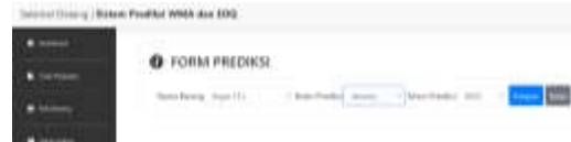
Gambar 3. Tampilan form prediksi

form prediksi. Admin dapat memilih nama barang yang akan diprediksi, bulan prediksi dan tahun prediksi untuk dapat melihat hasil prediksi. Setelah klik button simpan, sistem akan menampilkan hasil prediksi yang secara otomatis akan tersimpan.