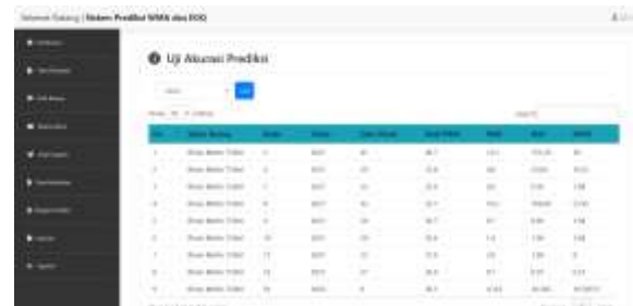
Gambar 5. Tampilan hasil uji akurasi prediksi

Gambar 5 merupakan tampilan halaman hasil uji akurasi prediksi. Pada halaman Riwayat prediksi, klik hasil uji akurasi untuk menuju halaman uji akurasi prediksi. Admin perlu memilih nama barang. Kemudian akan ditampilkan tabel yang berisi nama barang, bulan, tahun, data aktual, hasil WMA, nilai MAD, nilai MSE dan nilai MAPE.