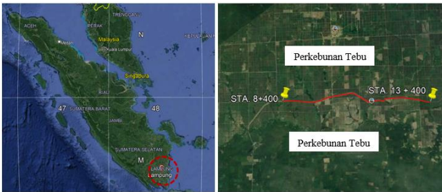
Gambar 1. Lokasi Proyek

Lokasi penelitian adalah di Jalan Simpang Penawar – Gedong Aji Baru – Rawajitu Provinsi Lampung. Pada penelitian ini direncanakan sepanjang 5 km yaitu dimulai dari STA 8+400 sampai dengan STA 13+400.