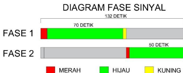
Gambar 1. Diagram sinyal simpang eksisting

Data waktu sinyal kondisi eksisting yang didapat dari hasil survei diolah untuk menentukan waktu siklus pada simpang bersinyal Jalan Raya Pilang – Jalan Raya Banar Pilang. Terdapat dua fase pada simpang yang diteliti. Pergerakan dari pendekat utara (Jalan Raya Pilang-Sukodono) dan pendekat selatan (Jalan Raya Banar Pilang) termasuk dalam fase 2. Sedangkan untuk pergerakan dari pendekat barat (Jalan Raya Pilang-Wonoayu) dan pendekat timur (Jalan Raya Pilang-Lebo) termasuk dalam fase 1.