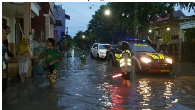
Gambar. 1 Banjir yang terjadi di Perumahan Karangduren Permai Kecamatan Pakisaji Kabupaten Malang