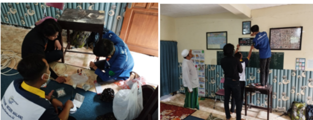
Gambar 5 Perakitan Dan Pemasangan Instalasi Jam Digital

Adapun komponen yang dibutuhkan untuk instalasi jam digital antara lain stop kontak, kabel, clamp kabel, stecker , dan terminal. Sedangkan perlengkapan yang dibutuhkan untuk pemasangan diantaranya palu, obeng, dan tang potong. Perakitan dan pemasangan instalasi jam digital ditunjukkan pada Gambar 5 di bawah.