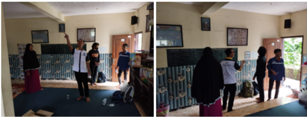
Gambar 4. Pemilihan Lokasi Pemasangan Jam Digital

ruang salat PPTQ AL Falah yang posisinya mudah dilihat oleh jamaah salat dengan dokumentasi seperti pada Gambar 4 di bawah. Pemilihan posisi pemasangan digital pada akhirnya ditempatkan pada dinding sebelah selatan ruang salat PPTQ Al Falah.