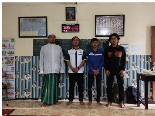
Gambar 6 Serah Terima Jam Digital kepada Mitra