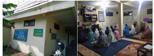
Gambar 2. Survei Kondisi Mitra

PPTQ Al Falah Kota Malang yang merupakan salah satu pondok pesantren Tahfidz Qur'an dengan santri perempuan, yang mana setiap salat berjamaah tidak ada muadzin sebagai pengingat waktu salat seperti yang ditunjukkan pada 2 di bawah.