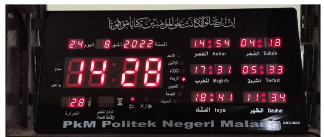
Gambar 3. Jam Digital

Pelaksanaan Pengabdian kepada Masyarakat yang dilakukan pelaksanaan diawali dengan pengadaan jam digital yang di dalamnya terpasang alarm dengan suara adzan salat wajib 5 waktu. Adapun bentuk jam digital tersebut ditunjukkan pada Gambar 3 di bawah.