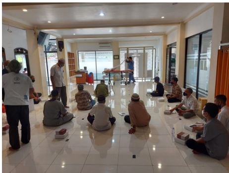
Gambar 1 Minat masyarakat yang mengikuti kegiatan PKM

Hasil yang dicapai dengan kegiatan Pengabdian Kepada Masyarakat ini adalah dapat memberikan bekal pengetahuan cara perawatan jenazah muslim kepada Pengurus Paguyuban Kematian RW XI Kelurahan Tulusrejo Kecamatan Lowokwaru Kota Malang, sehingga jika terdapat masyarakat di RW XI yang meninggal dunia dapat melakukan cara perawatan jenazah yang sesuai dengan syariat Islam. Perlu dibuatkan juga Buku Praktis Pengurusan Jenazah seperti terlihat pada Gambar 2.