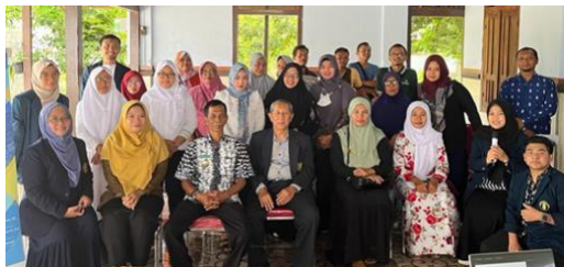
Gambar 4. Tim Pengabdian Bersama Kelompok UMKM

Selanjutnya, sebagai penutup rangkaian dari kegiatan pengabdian ini, dilakukan sesi diskusi dan tanya jawab, dan dalam sesi ini peserta sangat antusias sekali terbukti dari beberapa pertanyaan yang muncul dan mundurnya waktu selesai aara dari yang dijadwalkan.