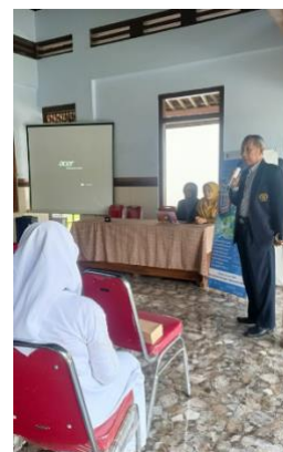
Gambar 1. Pemaparan Materi oleh Tim Pengabdian

Selanjutnya, dalam kegiatan ini peserta diberikan materi bertema tentang sumber modal yang aman. Materi ini memberikan gambaran tentang beberapa hal penting dalam pendanaan modal bagi UMKM, seperti Analisis Bagi UMKM Untuk Melakukan Pinjaman Modal, Analisis Proyeksi Proyeksi Pendapatan Dan Pengeluaran, Permasalahan Pengelolaan Keuangan, inti pengelolaan dana, Hal yang harus diperhatikan sebelum menggunakan Layanan Pinjaman online, tips dan trik terhindar pinjol ilegal, serta langkah-langkah mengecek legatlitas pinjaman online (pinjol).