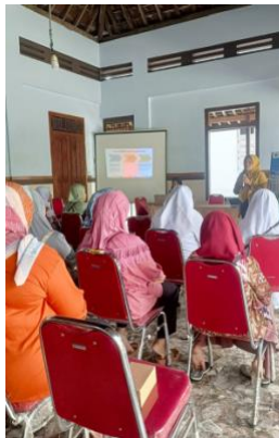
Gambar 3. Sesi Diskusi

mendapat pinjaman modal yang ilegal. Seperti, hindari iklan ajakan yang mencolok, cek pinjaman dari situs resmi OJK di alamat https://www.ojk.go.id/id/kanal/iknb/financialtechnology/Default.aspx , Lalu ketik "Financial Technology-P2P Lending OJK" di mesin pencarian, lalu klik situs web OJK yang muncul di laman hasil, pastikan legalitas dan rekam jejak digital, download penyedia layanan aplikasi resmi, teliti syarat dan ketentuan berlaku, hindari peminjaman dengan fee besar, serta waspada penyalahgunaan data pribadi.