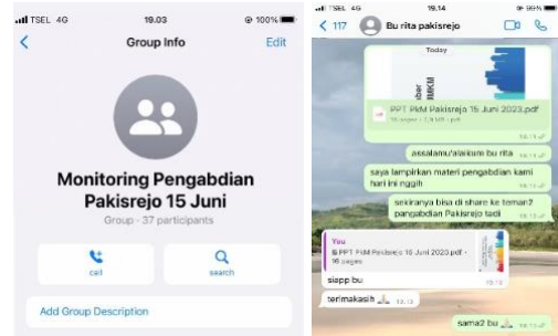
Gambar 4. Sesi Monitoring

mendapatkan dukungan dalam mencari alternatif sumber pendanaan, mulai dari aspek teknis, persiapan dokumen, hingga sebagai sarana pertukaran informasi di antara pelaku UMKM.