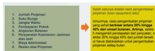
Gambar 2. Analisa Bagi UMKM Untuk Melakukan Pinjaman Modal

Sebelum mengajukan pinjaman modal, UMKM perlu mempertimbangkan beberapa hal agar proses pinjaman berjalan dengan lancar dan keputusan yang diambil dapat mendukung keberhasilan usaha. Gambar 2 menunjukkan beberapa hal yang perlu diperhatikan sebelum melakukan pinjaman modal