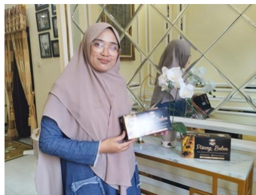
Gambar 8. Kemasan Baru

Jika dibandingkan dengan kegiatan serupa, hasil program ini menunjukkan konsistensi dengan temuan (Ryas et al., 2025) Yang melakukan redesign identitas visual kemasan UMKM Loafjkt menggunakan metode yang sama yaitu metode Design Thinking , di mana pendekatan berbasis empati dan iterasi desain terbukti menghasilkan kemasan yang lebih relevan dengan kebutuhan konsumen. Demikian pula (Sujanto et al., 2021) dalam program pendampingan UMKM Kue Muffin menemukan bahwa pengembangan identitas visual secara terpadu (mencakup logo, warna dan tipografi) mampu meningkatkan persepsi kualitas produk secara signifikan di kalangan konsumen local. Perbedaan utama kegiatan ini dibandingkan dua program tersebut terletak pada pendekatan co-design yang melibatkan mitra secara aktif dalam setiap tahapan revisi desain, sehingga hasil akhir lebih sesuai dengan karakter dan visi usaha mitra. Selain itu menegaskan bahwa desain kemasan yang diperbarui secara strategis berpengaruh positif terhadap Keputusan pembelian konsumen produk local UMKM, suatu temuan yang selaras dengan peningkatan minat beli sebesar 25% yang diperoleh dalam program ini.