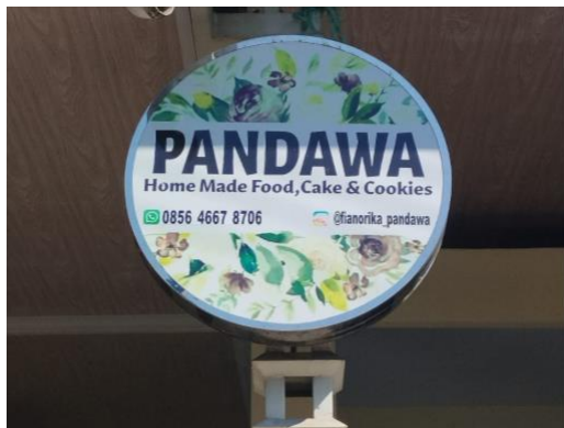
Gambar 1. Pandawa Food & Cookies

Upaya pendampingan UMKM melalui program pengabdian kepada masyarakat telah terbukti efektif dalam meningkatkan kapasitas produksi dan pemasaran mitra (Eka Apriyani et al., 2025)