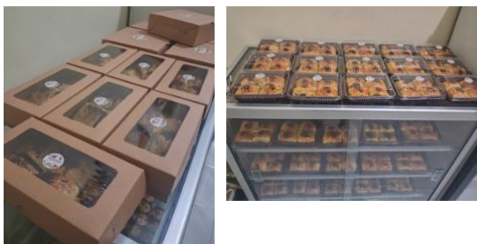
Gambar 2. Kemasan Produk Pandawa Food & Cookies (Desain Lama)

Gambar 2 berikut menunjukkan kemasan yang saat ini digunakan oleh Pandawa Food & Cookies. Terlihat bahwa desain kemasan masih bersifat konvensional dan belum merepresentasikan karakter maupun keunikan produk.