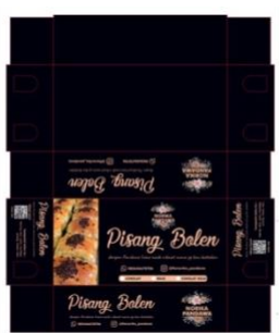
Gambar 5. Prototipe Kemasan Baru

Setelah disetujui mitra, desain diproduksi dalam bentuk prototipe untuk diuji coba estetika, keterbacaan, dan kesesuaian dengan karakter produk.