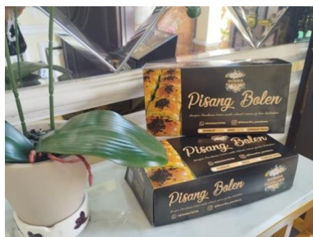
Gambar 6. Hasil Kemasan Baru

Penggunaan kemasan baru pada platform digital (Instagram dan TikTok) membantu meningkatkan brand engagement berdasarkan monitoring komentar dan like.