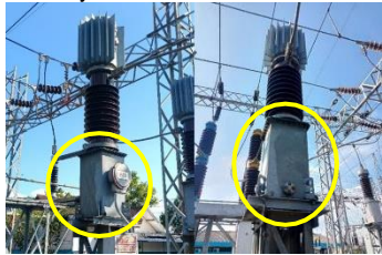
GAMBAR 3.1 KONDISI CT SEBELUM PENGGANTIAN