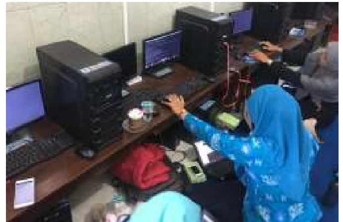
Gambar 4. Kondisi Peserta Pelatihan

Terlihat peserta antusias saat mempraktikkan langsung konfigurasi server berbasis Debian 7 pada sistem komputer seperti yang ditampilkan pada gambar 4.