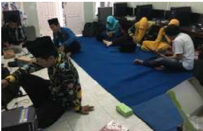
Gambar 3. Suasana Pelatihan

Suasana saat pelatihan dilakukan di Laboratorium Jaringan Komputer SMK Queen Al Falah, Desa Ploso, Kecamatan Mojo, Kabupaten Kediri ditampilkan pada gambar 3.