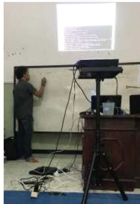
Gambar 4. Instruktur Menjelaskan Materi

Gambar 4 nampak instruktur sedang menjelaskan materi konfigurasi server berbasis Debian 7.