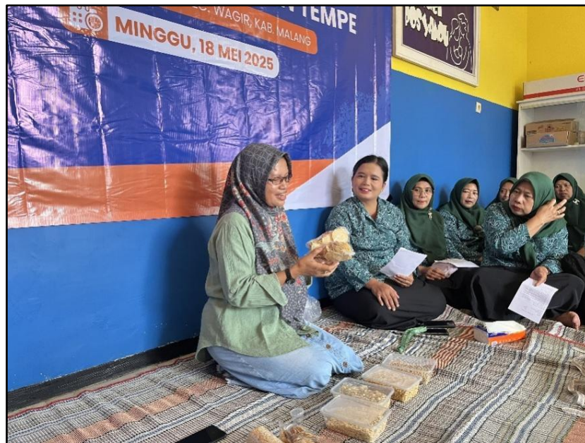
Gambar 3. Kegiatan Pelaksanaan Pembuatan Tempe

Pelaksanaan kegiatan pelatihan pembuatan tempe di Kelurahan Sidorahayu secara umum berjalan dengan lancar dan sesuai dengan agenda yang telah diencanakan bersama sebelumnya. Tahapan mulai dari penyuluhan tentang berbagai jenis kacang dapat dimanfaatkan sebagai bahan baku alternatif pengganti kedelai dalam pembuatan tempe untuk menghasilkan pangan fungsional [3]. Selanjutnya pengamatan proses dan penjelasan mengenai tahapan pembentukan tempe juga berjalan dengan baik dan lancar seperti pada Gambar 3. Warga Kelurahan Sidorahayu pada umumnya juga dapat mengikuti seluruh tahapan kegiatan ini dengan baik dan penuh antusias.