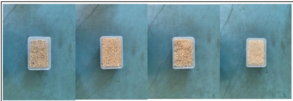
Gambar 5. Proses Pembentukan Tempe