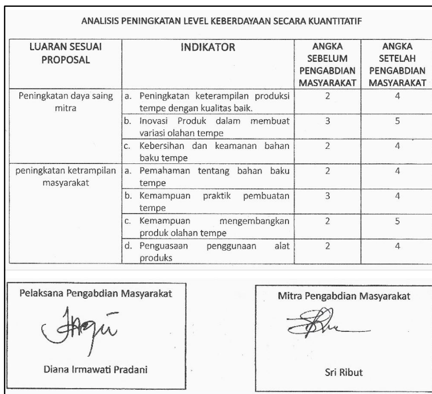
Gambar 4. Hasil Kuisisioner Sebelum dan Sesudah dilakukan Bimbingan Teknis

2. Keterampilan dan kemampuan warga juga meningkat dalam pembuatan tempe. Warga memiliki pemahaman tentang proses pembuatan tempe dan faktor atau unsur apa saja yang berpengaruh terhadap hasil dari produk tempe nantinya. Peningkatan ini dapat dilihat dari hasil kuesioner yang diberikan sebelum dan setelah dilakukan pelatihan. Dengan hasil analisa berupa peserta mampu memproduksi tempe dengan kualitas yang lebih baik dengan tekstur lebih padat, warna lebih seragam, dan fermentasi lebih stabil. Peserta menunjukkan kreativitas dalam mengembangkan olahan tempe seperti tempe crispy, tempe bacem modern, dan tempe dalam kemasan menarik. Ini menunjukkan peningkatan daya saing usaha. Ada kesadaran yang lebih tinggi dalam memilih kedelai berkualitas dan menjaga higienitas proses produksi. Peningkatan signifikan pada penguasaan alat produksi dan praktik langsung. Meski demikian, aspek praktik pembuatan tempe masih bisa ditingkatkan lebih lanjut. Masyarakat mitra menjadi lebih percaya diri dan termotivasi untuk menjadikan produksi tempe sebagai peluang usaha mandiri. Kegiatan Bimbingan Teknik Pembuatan Tempe berhasil meningkatkan kompetensi dan kemandirian mitra secara nyata. Rata-rata peningkatan sebesar 87% menunjukkan program berjalan efektif dan relevan dengan kebutuhan mitra, khususnya dalam meningkatkan keterampilan produksi, memperluas inovasi produk, serta memperkuat aspek kebersihan dan efisiensi alat seperti pada Gambar 4.