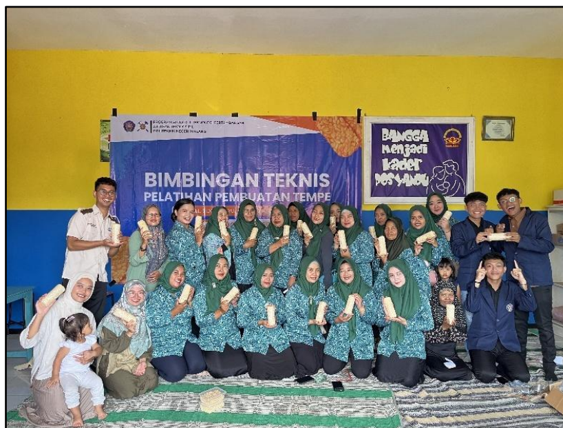
Gambar 6. Kegiatan Pelatihan Pembuatan Tempe