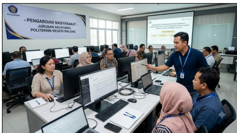
Gambar 2. Dokumentasi Pelaksanaan Hands-on Workshop Pemanfaatan AI Tools bersama Dosen Mitra di Laboratorium Komputer Akuntansi Polinema

Contoh formula prompting akademik yang diterapkan dosen mitra untuk menyusun materi ajar adalah sebagai berikut: "Bertindaklah sebagai Ahli Kurikulum Pendidikan Vokasi dan Dosen Bahasa Inggris Bisnis Senior. Buatlah sebuah skenario studi kasus interaktif mengenai negosiasi kontrak ekspor-impor yang memuat minimal 5 kosakata teknis logistik untuk mahasiswa Akuntansi tingkat diploma. Berikan instruksi penyelesaian berbasis Project-Based Learning dan batasi teks maksimal 300 kata." Melalui metode ini, dosen mitra mampu melahirkan produk konkret berupa draf Rencana Pembelajaran Semester (RPS) baru dan modul instruksional interaktif.