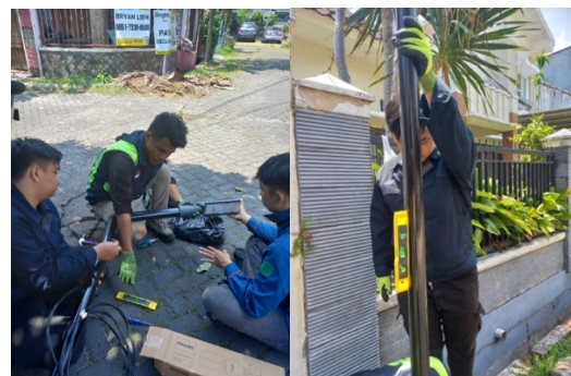
Gambar 3. Praktik penyambungan, pemasangan tiang PJU

Selanjutnya, pada tahap pelaksanaan bimbingan teknis, kegiatan difokuskan pada pemberian pelatihan teori dan praktik kepada Karang Taruna mengenai dasar kelistrikan, pengenalan komponen utama PJU, serta prinsip kerja sistem otomasi sensor cahaya. Peserta diperkenalkan dengan komponen seperti MCB, kabel penghantar, armatur lampu LED, dan sensor photocell . Pendekatan yang digunakan adalah learning by doing , sehingga peserta tidak hanya menerima materi, tetapi juga melakukan praktik penyambungan, pemasangan tiang, dan simulasi kerja sistem secara langsung. Melalui proses ini, mitra memperoleh pengalaman awal mengenai standar instalasi yang aman dan penerapan sistem otomasi yang efisien sebagaimana ditunjukkan pada Gambar 3.