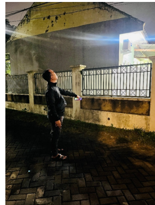
Gambar 2. Penentuan titik PJU yang akan dipasang

pemasangan lampu serta melakukan survei kondisi eksisting PJU. Kegiatan ini mencakup sosialisasi program, penjelasan tujuan pengabdian, pembagian tugas antara tim dosen, mahasiswa, dan masyarakat, serta identifikasi denah ruas jalan dan titik penerangan yang menjadi prioritas. Melalui tahapan ini diperoleh lokasi pilot dan kebutuhan teknis yang menjadi dasar perancangan sistem PJU otomatis berbasis sensor photocell sebagaimana ditunjukkan pada Gambar 2.