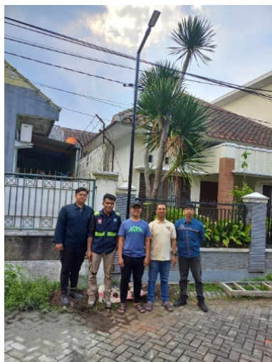
Gambar 6. Serah terima hasil Pembangunan PJU dengan sensor photocell

Pada tahapan peningkatan pengetahuan Karang Taruna, kegiatan pengabdian ini tidak hanya menghasilkan infrastruktur fisik berupa PJU otomatis, tetapi juga meningkatkan keterlibatan mitra dalam memahami teknik instalasi kelistrikan, prinsip kerja sensor, serta pentingnya efisiensi energi. Anggota Karang Taruna memperoleh pengalaman langsung melalui praktik penyambungan, pemasangan tiang, simulasi kerja sensor, serta pengamatan uji nyala dan padam lampu. Untuk menindaklanjuti saran evaluasi reviewer , penilaian pemberdayaan disiapkan melalui survei singkat berbasis skala 1-5 yang dapat diisi oleh peserta setelah kegiatan. Format indikator survei penerimaan pengguna dan pemahaman mitra ditunjukkan pada Tabel 4, sehingga data kuantitatif aktual dapat dimasukkan pada naskah akhir sesuai hasil kuesioner lapangan.