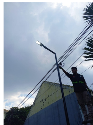
Gambar 5. Pengujian PJU dengan sensor photocell

yaitu kondisi gelap dan terang. Saat sensor ditutup untuk menghalangi cahaya, sistem secara otomatis menyalakan lampu LED sebagai indikator fungsi ON berjalan baik. Sebaliknya, ketika sensor terbuka dan menerima cahaya, aliran listrik ke lampu terputus sehingga lampu padam secara otomatis. Hasil pengujian menunjukkan sensor bekerja dengan waktu respons sekitar 2-3 detik dan memiliki stabilitas terhadap perubahan intensitas cahaya lingkungan. Uji lapangan selama dua hari menunjukkan lampu menyala otomatis sekitar pukul 17.45 WIB dan padam kembali sekitar pukul 05.30 WIB, menandakan sistem bekerja efektif dalam kondisi cuaca berbeda sebagaimana ditunjukkan pada Gambar 5.