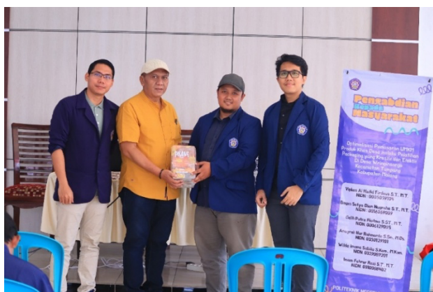
Gambar 3. Presentasi Dan Penyerahan

mitra untuk meningkatkan nilai jual produk secara mandiri. Kegiatan ini diakhiri dengan pemaparan konsep final desain kepada mitra, yang dilanjutkan dengan proses serah terima luaran secara simbolis. Pada momen tersebut, tim pengabdian menyerahkan hasil cetak kemasan ( packaging ) dan identitas visual baru produk Jamu Sinom kepada perwakilan UMKM, disaksikan langsung oleh Kepala Desa Wringinsongo. Penyerahan ini menandai dimulainya penggunaan kemasan baru secara resmi untuk mendukung pemasaran produk yang lebih luas.