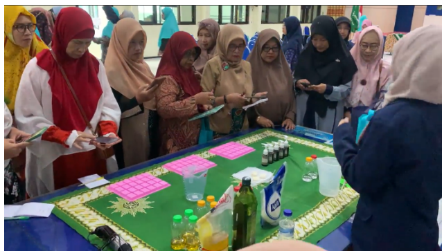
Gambar 1. Dokumentasi antusias mitra PPM

ramah lingkungan. Selanjutnya, sesi diskusi digunakan untuk mendorong partisipasi aktif peserta dalam mengeksplorasi potensi inovasi produk serta strategi pemasaran sabun cair organik. Pada sesi praktik, peserta didampingi oleh dosen dan mahasiswa untuk melakukan proses pembuatan sabun cair berbahan kopi, mulai dari penimbangan bahan, pencampuran, hingga tahap pengemasan produk akhir. Seluruh proses dilakukan dengan memperhatikan aspek kebersihan, keamanan, dan efisiensi produksi.