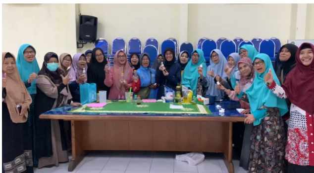
Gambar 2. Dokumentasi kegiatan PPM

Setelah sesi pembukaan, kegiatan dilanjutkan dengan penyampaian materi mengenai pembuatan sabun cair organik berbahan dasar kopi. Dalam sesi ini, peserta diperkenalkan pada konsep dasar sabun cair, peran surfaktan, serta manfaat penggunaan bahan aktif alami dalam produk perawatan tubuh. Narasumber menjelaskan bahwa kopi memiliki kandungan bioaktif seperti kafein, polifenol, dan asam klorogenat yang berfungsi sebagai antioksidan alami dan agen eksfoliasi lembut, sehingga efektif membantu menjaga kebersihan serta kesehatan kulit [10]. Limbah ampas kopi sebagai bahan aktif dalam sabun cair juga mendukung prinsip green product, yaitu produk ramah lingkungan yang meminimalkan penggunaan bahan sintesis serta terbukti efektif sebagai bahan pengisi maupun agen eksfoliasi ( Scrub ) alami [11], [12]. Tujuan utama pelatihan ini adalah agar peserta mampu menciptakan sabun cair dari kopi yang tidak hanya berfungsi untuk membersihkan kulit, tetapi juga memberikan efek perawatan kecantikan alami sekaligus meningkatkan nilai jual produk di pasaran. Sesi teori berlangsung interaktif; peserta aktif bertanya tentang formulasi bahan, pengaturan kekentalan, dan cara menjaga kestabilan produk agar layak dipasarkan.