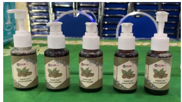
Gambar 3. Produk sabun cair organik dari kopi

Untuk mempermudah peserta dalam mengingat dan menerapkan kembali prosedur pembuatan sabun cair kopi di rumah, tim pengabdian menyiapkan brosur panduan lengkap yang dibagikan kepada seluruh peserta. Brosur tersebut berisi informasi mengenai manfaat kopi sebagai bahan aktif alami, fungsi setiap komponen dalam formulasi sabun cair, serta langkah-langkah rinci pembuatan. Panduan visual ini dirancang untuk mendukung kemandirian peserta setelah pelatihan berakhir, sehingga mereka dapat mereplikasi proses produksi secara mandiri tanpa perlu pendampingan lanjutan. Penyediaan media pendukung seperti ini terbukti efektif dalam meningkatkan daya ingat dan kemampuan aplikatif peserta [8]. Dengan adanya panduan tertulis, peserta dapat menjadikan kegiatan ini sebagai modal awal untuk memulai produksi sabun cair kopi skala rumah tangga sebagai bentuk diversifikasi usaha UMKM mereka.