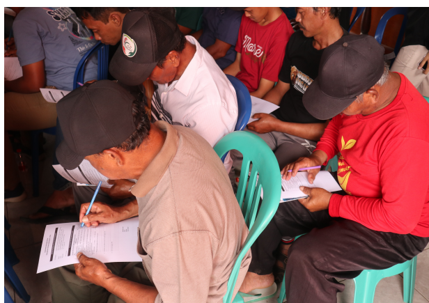
Gambar 4. Pengisian Kuisisioner oleh Peserta PPM

Peserta kegiatan, yang terdiri dari perwakilan kelompok tani, pengurus RT, dan warga Desa Tulusbesar, menunjukkan antusiasme tinggi selama sesi berlangsung. Diskusi interaktif terjadi ketika peserta menyampaikan pengalaman mereka dalam mengolah limbah organik dan bertanya mengenai cara mempertahankan kualitas kompos serta strategi pemasaran produk. Tim pelaksana memberikan tanggapan dan bimbingan teknis berdasarkan prinsip-prinsip pengelolaan pupuk organik yang baik, termasuk cara menjaga kelembapan kompos, mengatur aerasi, serta menentukan lokasi penyimpanan yang ideal agar mutu produk tetap terjaga.