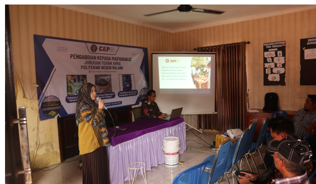
Gambar 3. Penyampaian materi

Materi berikutnya menekankan pada proses teknis pengomposan yang benar dan efisien. Peserta mendapatkan penjelasan langkah demi langkah mulai dari persiapan bahan baku berupa limbah rumah tangga dan pertanian, proses pencacahan agar bahan lebih mudah terurai, hingga pengaturan kelembapan yang optimal agar mikroorganisme pengurai dapat bekerja secara maksimal [12, 13]. Disampaikan pula pentingnya pembalikan kompos secara berkala untuk menjaga sirkulasi udara dan mencegah pembusukan anaerob, serta penanganan air lindi agar tidak mencemari lingkungan. Pemateri memberikan contoh tentang pengelolaan kompos yang baik, termasuk cara menentukan waktu panen kompos berdasarkan perubahan warna dan tekstur bahan, sehingga peserta dapat memahami indikator keberhasilan proses pengomposan. Materi ini disampaikan dalam upaya penguatan proses pengomposan sehingga kualitas kompos yang dihasilkan masyarakat dapat lebih seragam dan memenuhi standar yang diperlukan untuk pengelolaan kompos secara komunal.