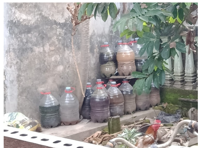
Gambar 1. Pupuk cair produksi warga

Hasil survei menunjukkan bahwa sebagian warga telah menerapkan materi yang diberikan pada kegiatan pengabdian periode lalu secara mandiri dan berkelanjutan, sehingga mampu menghasilkan kompos dari limbah organik rumah tangga di lingkungan masing-masing. Kondisi ini menunjukkan adanya peningkatan kesadaran dan partisipasi masyarakat dalam pengelolaan sampah.