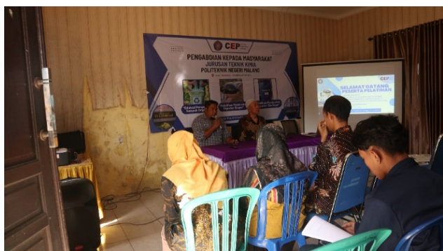
Gambar 2. Pembukaan oleh perwakilan pemerintah desa

Kegiatan Pengabdian kepada Masyarakat bertema “Edukasi Pengelolaan Pupuk Organik (Kompos) Hasil Swadaya Masyarakat Skala Komunal di Desa Binaan Polinema, Tulusbesar, Kecamatan Tumpang, Kabupaten Malang” telah dilaksanakan pada tanggal 15 Juni 2025 bertempat di Balai Desa Tulusbesar. Sebanyak 22 warga Desa Tulusbesar menghadiri kegiatan Pengabdian ini. Acara diawali dengan sambutan dari perwakilan Pemerintah Desa Tulusbesar yang menyampaikan apresiasi atas inisiatif Politeknik Negeri Malang dalam membantu masyarakat meningkatkan kapasitas pengelolaan sumber daya lokal melalui pengolahan limbah organik menjadi produk bernilai ekonomi. Sambutan berikutnya diberikan oleh perwakilan Jurusan Teknik Kimia Polinema yang menegaskan pentingnya kolaborasi antara akademisi dan masyarakat dalam menciptakan sistem pertanian berkelanjutan melalui pemanfaatan limbah organik secara efisien.